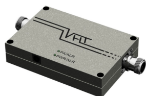
AMPLIFICADOR PA 1800 UL 15M